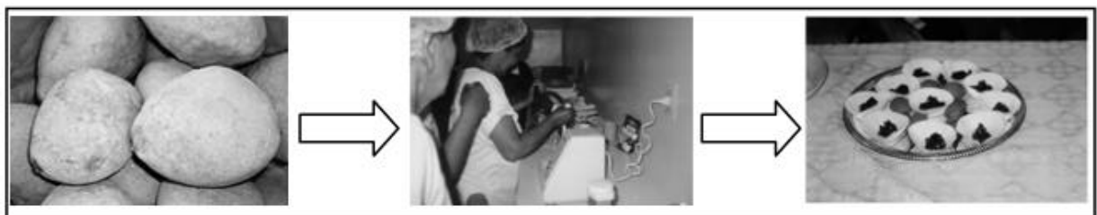
Figura 3 – Processo de elaboração de receitas caseiras de Baru.

Algumas mulheres do Assentamento Andalúcia tiveram a oportunidade de realizar curso de capacitação com nutricionistas da Universidade Católica Dom Bosco (UCDB). Elas aperfeiçoaram receitas caseiras com as normas de conduta para manipulação de alimentos (Figura 3). Além disso, a busca por alternativas de trabalho dentro do assentamento levou à criação da oficina de tecelagem. As mãos, calejadas pelo trabalho na roça, agora tecem peças delicadas. A percentagem de 70% que recebem fica com as mulheres e o restante é reinvestido na oficina. As peças, feitas sob encomenda, já foram exportadas para Alemanha, Inglaterra e Estados Unidos (MSTV, 2004).